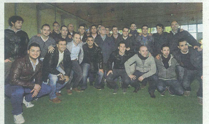
El azulgrana posó con sus ex compañeros en la cantera del Albacete.