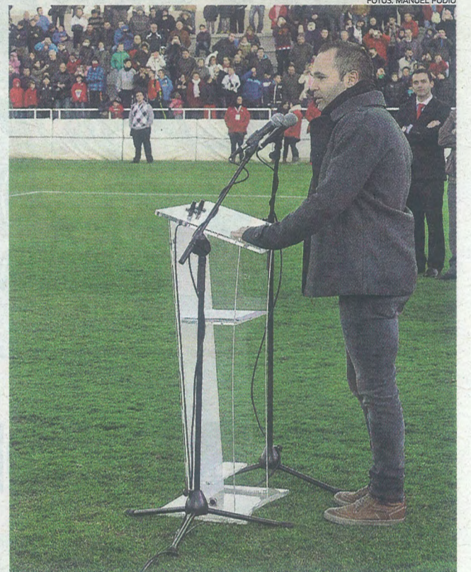
Iniesta (28) dedicó unas palabras a sus paisanos.

Cesc Fàbregas empieza a ver la luz al final del túnel y hoy a sido una de las primeras veces en la que ha visto claro que podría estar a tiempo de llegar al derbi contra el Espanyol del próximo 6 de enero. El centrocampista se ejercitó ayer por la mañana junto a Juanjo Brau y sus sensaciones han sido muy buenas. Cesc se está recuperando de una rotura en el bíceps femoral de la pierna izquierda, que se produjo ante el Betis el pasado 9 de diciembre.